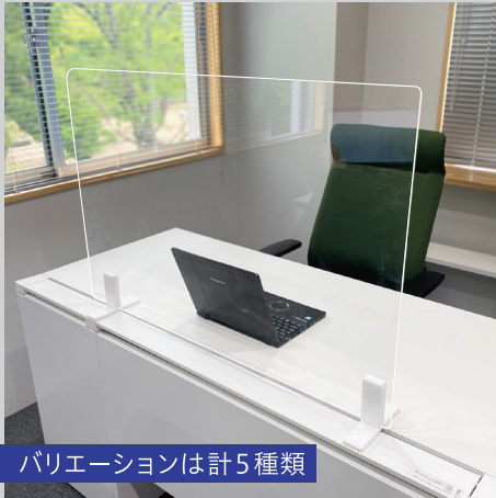
バリエーションは計5種類