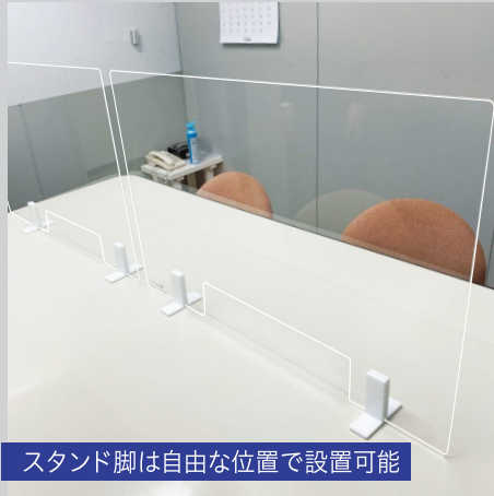
スタンド脚は自由な位置で設置可能