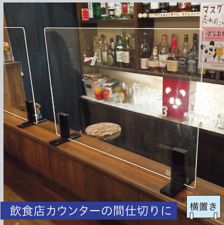
飲食店カウンターの間仕切りに