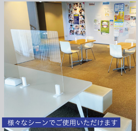
様々なシーンでご使用いただけます