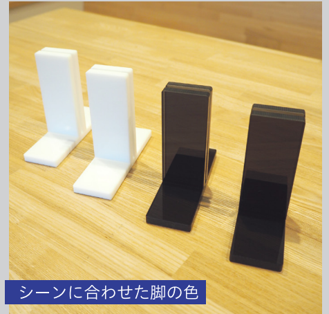
シーンに合わせた脚の色