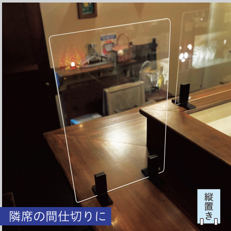
隣席の間仕切りに